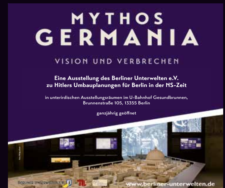
2020-03 Fotos: Arnold, Happel, Salm (Anzeige Mythos Germania: Philipp Dase) • Design: Friedrich & Happel

Berliner Unterwelten e.V. Info-Telefon: (030) 49 91 05 18 Brunnenstraße 105 Büro-Telefon: (030) 49 91 05 17 13355 Berlin Telefax: (030) 49 91 05 19 info@berliner-unterwelten.de www.berliner-unterwelten.de Bankverbindung IBAN: DE78 1001 0010 0791 6111 04 BIC: PBNKDEFF