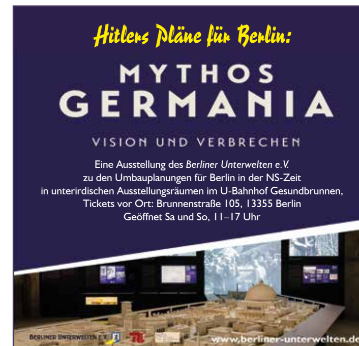
2020-10 Fotos: Arnold, Happel, Salm (Anzeige Mythos Germania: Philipp Dase) • Design: Friedrich & Happel

Unterstützen Sie uns dabei, dass es die Berliner Unterwelten 2021 noch gibt!