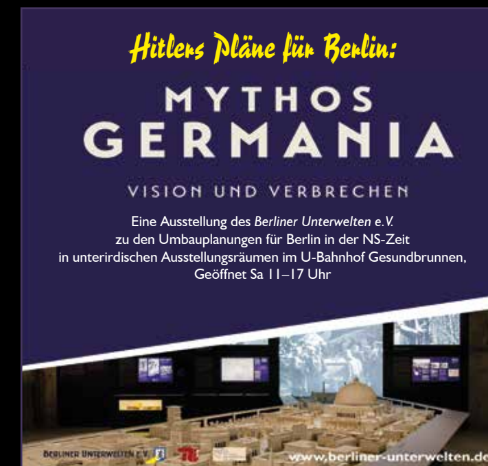
2021-07 Fotos: Arnold, Happel, Salm (Anzeige Mythos Germania: Philipp Dase) • Design: Friedrich & Happel

Spendenkonto bei der Sparkasse Berlin: IBAN: DE77 1005 0000 6600 3729 80 BIC: BELADEBEXXX