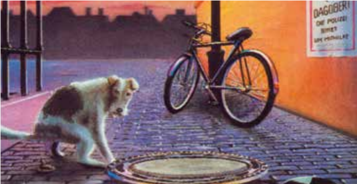
Illustration: Arno Funke

24. – 28. April 2017 18. – 22. September 2017