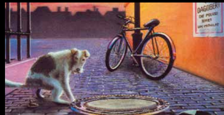
Illustration: Arno Funke

23. – 27. April 2018 17. – 21. September 2018