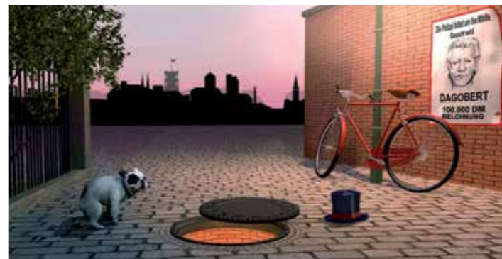
Illustration: Arno Funke

Das Seminar führt tief hinein in die »andere« Berliner Unterwelt: in das kriminelle und zwielichtige Milieu der Vergangenheit und Gegenwart. Spektakuläre Kriminalfälle, aber auch die komplexe Arbeit von Polizei und Justiz im Rahmen von Strafverfolgung und -vollzug werden dabei vorgestellt.