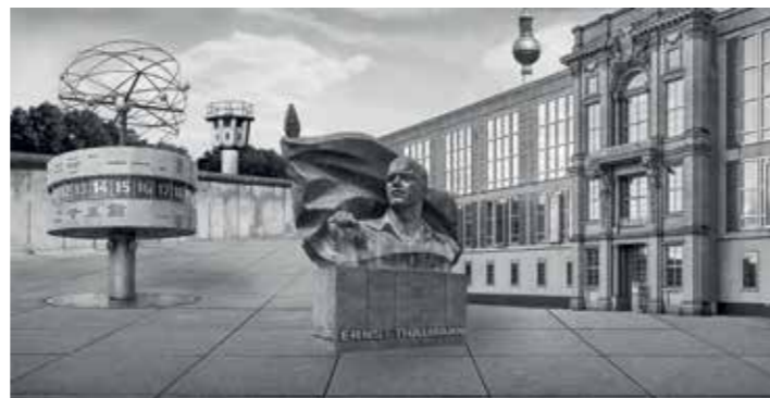
Fotocollage: Isabella Scheel

In Berliner Brennpunkten und märkischen Grauzonen – auf Spurensuche eines Staates zwischen Gründungsakt und Niedergang, Verheißung und Enttäuschung, Experiment und Biedermeier, Doktrin und Reform, Rebellion und Repression.