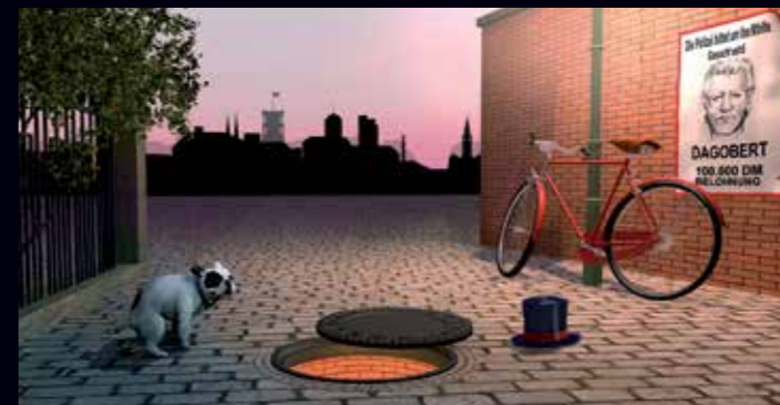
Illustration: Arno Funke

16. – 20. Juni 2025 10. – 14. November 2025