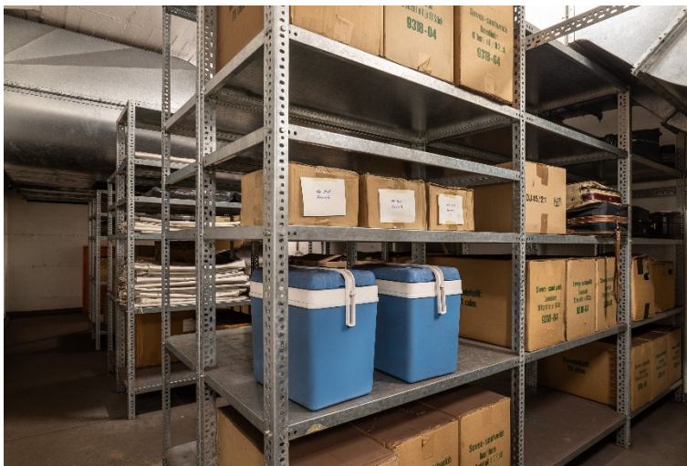
Tour Atombunker Pankstraße: Lagerraum