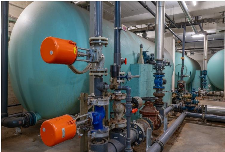
Tour Atombunker Pankstraße: Wasserwerk